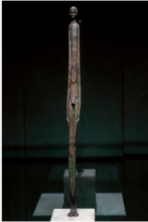
Statuetta votiva di Volterra

Giacometti era attratto dalle opere del passato remoto che compaiono spesso nei suoi schizzi: a Giuseppe Marchiori amico e critico spetta infatti il primo accostamento delle sottili figure dello scultore “all’idolo volterrano, all’uomo della notte”.